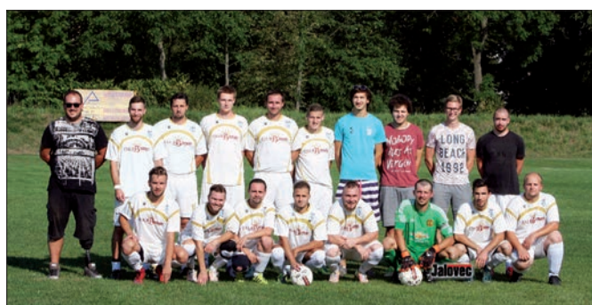
U hřiště či kdekoliv jinde, na viděnou, milí čtenáři.

Následující utkání s Horní Bečvou bylo vzhledem k týden trvajícím deštím odloženo prozatím na neurčito a poslední zářijové utkání se Stříteží se hraje až po uzávěrce tohoto čísla. Proto informace k dohrávce a reportáž z utkání naleznete až v následujícím čísle. I nadále se budeme snažit prostřednictvím facebooku (profil FANS TJ Poličná) a obecního rozhlasu vás co nejvíce informovat o novinkách okolo týmu a termínech utkání samotných. Držte nám pěsti, jelikož teď se tak trochu ukáže, na co letos máme a budeme potřebovat každého z Vás, aby nám pomohl. Každá pozitivní energie je vítána.