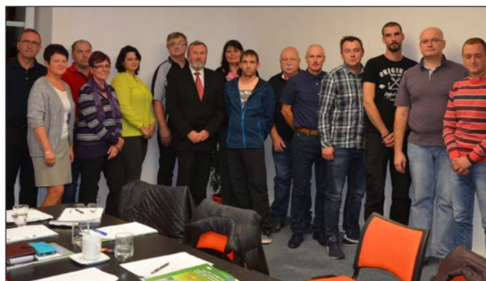
Zastupitelé obce 2018 - 2022