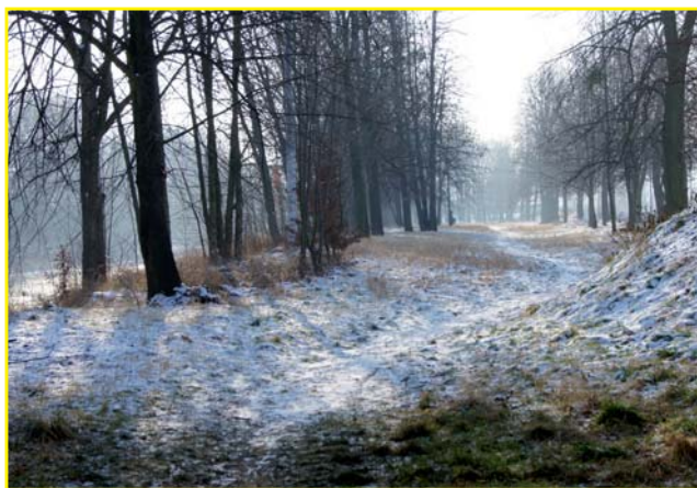
Zvláštní cena pro nejmladšího účastníka fotosoutěže - fotografie „Alej“ autor Lukáš Šťastný

Fotografie také naleznete vystavené na obecním úřadě a na webových stránkách.