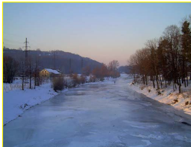
3. - 4. místo fotografie „Vodní toky“ autor Mojmir Seget