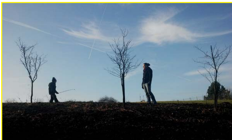
3. - 4. místo fotografie „Úlehla“ autor Michal Hadaš