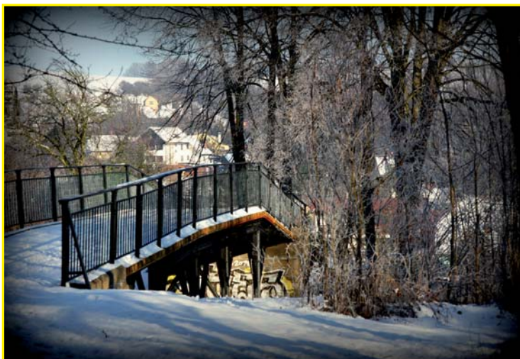
1. - 2. místo fotografie „Ježák“ autor Kristýna Foltová