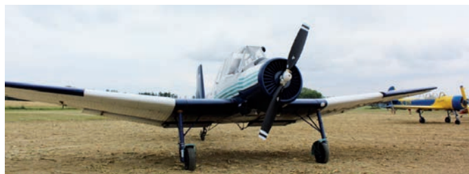
Text: Petra Mrovcová

Přesto, že je pátý ročník akce ještě daleko, pořadatelé již nyní připravují řadu novinek, o kterých vás budeme včas informovat.