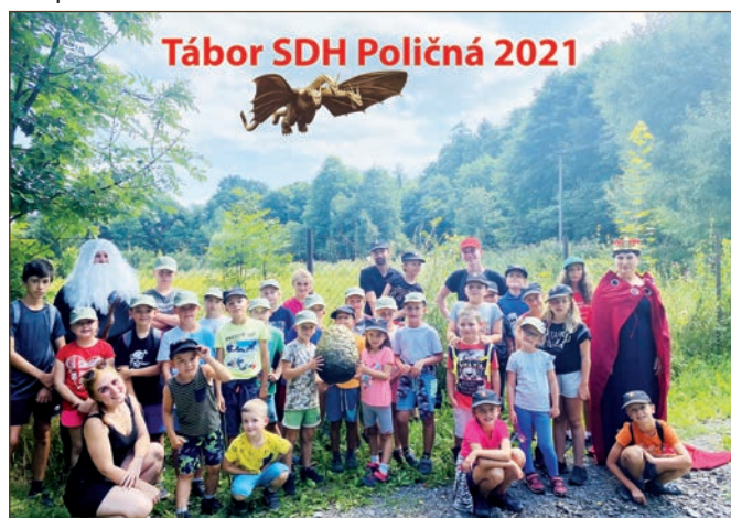
Sbor dobrovolných hasičů Poličná