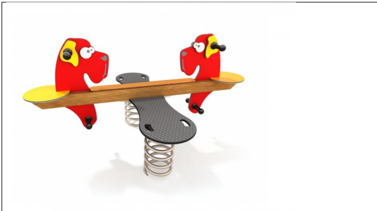
Položka 8 Houpací prvek na pružině 1-2 místný; Jen příklad může být použito 1-místné houpadlo Bezpečnostní plocha ANO, 4 m 2