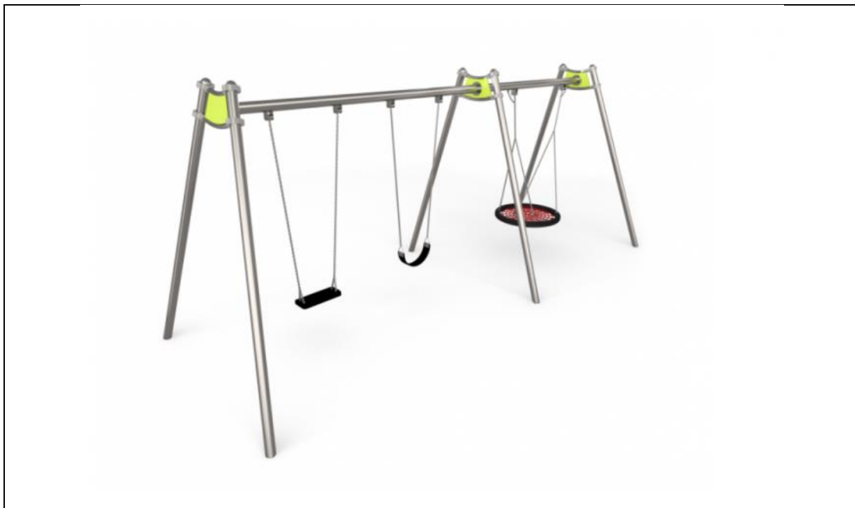
Položka 9 , houpačka závěsná 3 místná i pro nejmenší; Bezpečnostní plocha ANO, 42 m